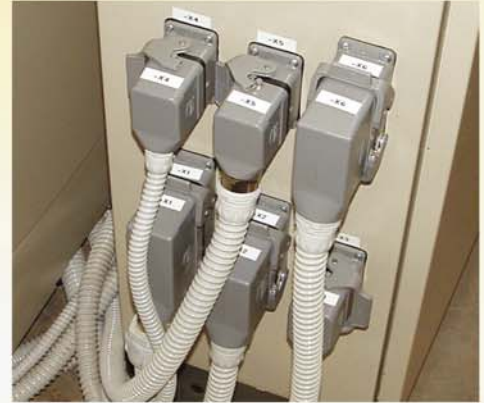
Steckverbindungen schnell trennbar und verwechslungssicher.