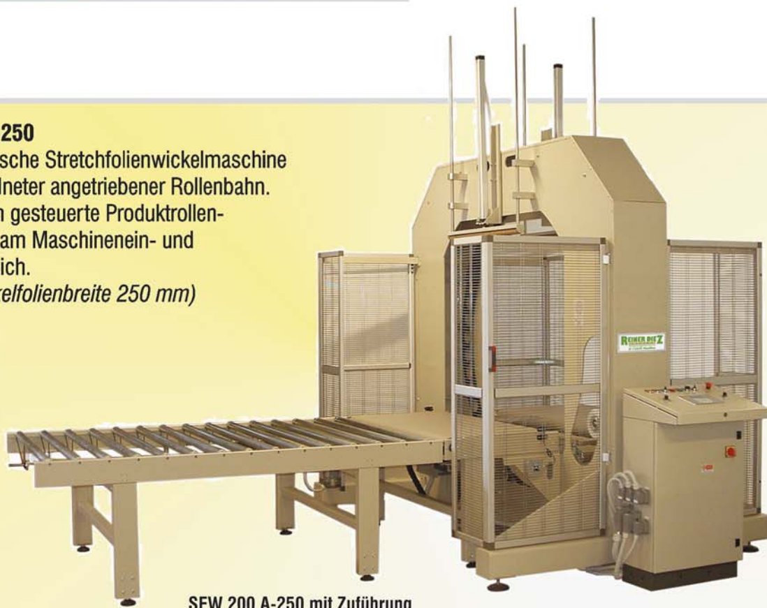
SFW 200 A-250 mit Zuführung