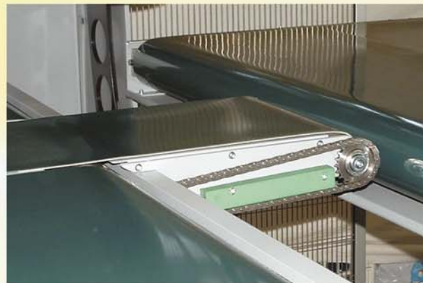
Verlängertes Spezialtransportband zur Verarbeitung von Produkten, die kürzer als 500 mm sind.