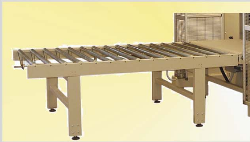
Produktzuführung mit angetriebener Rollenbahn.