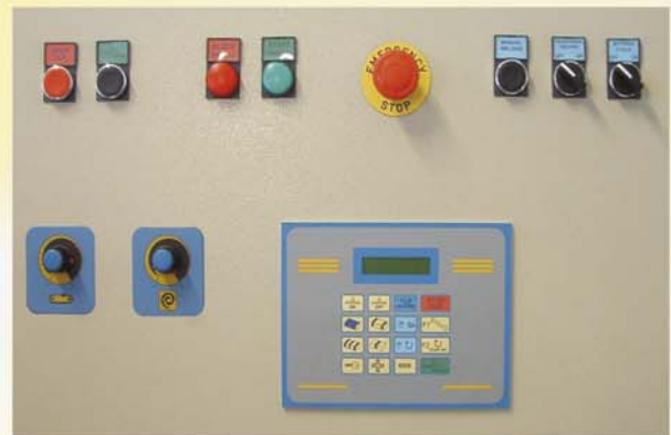
Bedienelemente mit übersichtlichem Bedienpanel.